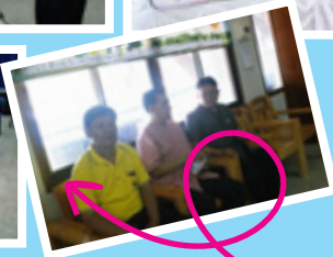
กลุ่ม โรงเรียนเอกขน