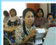
กลุ่ม อ.บ้านไผ่