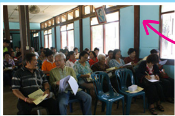
กลุ่มบ้านบุญ อ.ฉะเชิงเทรา