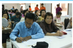
กลุ่ม บ้านบุญ อ.ป่าซาง