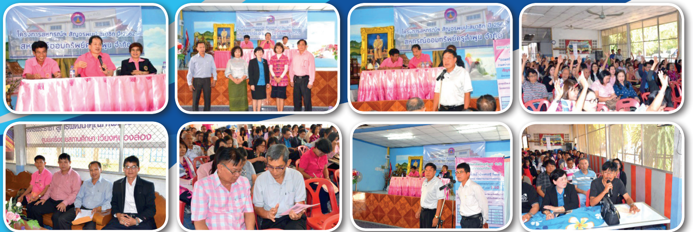
หน่วย อ.บ้านโฮ้ง (อ.เวียงหนองล่อง) และ บ้านนาญกลาง (อ.เวียงหนองล่อง)