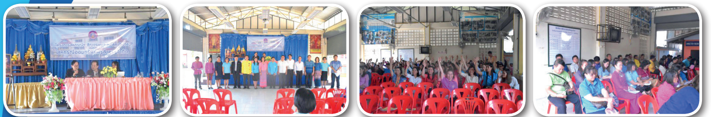
หน่วย อ.ป่าซาง