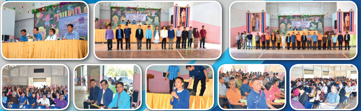
หน่วย อ.ลี้ (เหนือ)