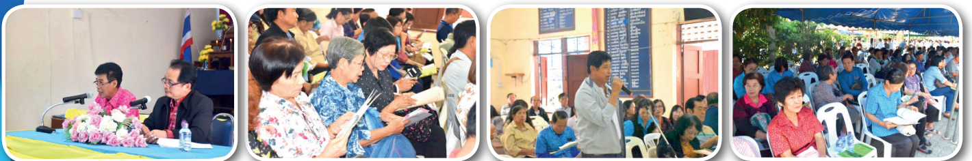
หน่วย บ้านนาญอำเภอเมือง